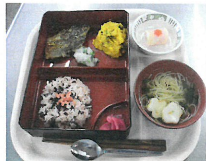
敬老会メニュー 赤飯・すまし汁・ピーナツの白身魚ムニエル カボチャのサラダ・和菓子・桜漬け